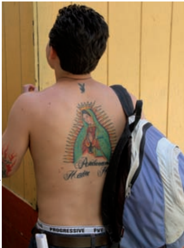
Deportado con tatuaje de la Virgen de Guadalupe.

En su origen, este cuerpo policíaco tenía como objetivo central enfrentar el contrabando de alcohol tanto de México como desde Canadá y, de manera secundaria, impedir el cruce de la migración china. El control del ingreso y la deportación de mexicanos es un tema que adquirió prioridad hasta mediados de la década de los 50, es decir, cerca de 100 años después de la redefinición de la frontera en el siglo XIX. 14 Durante largo tiempo, el flujo documentado o no de mexicanos hacia EE.UU. fue más una práctica social tolerada y habitual, en especial en las inmediaciones fronterizas y abiertamente en beneficio de determinados sectores de la economía estadounidense, como el agrícola.