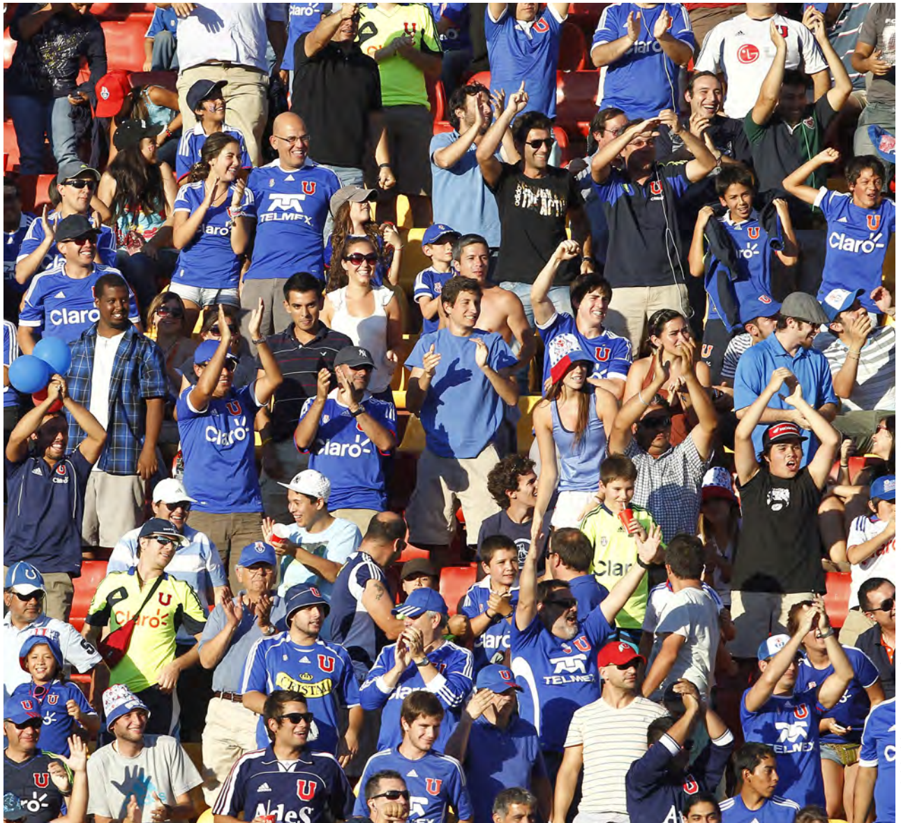
Universidad de Chile v San Marcos de Africa — Torneo Transición 2013