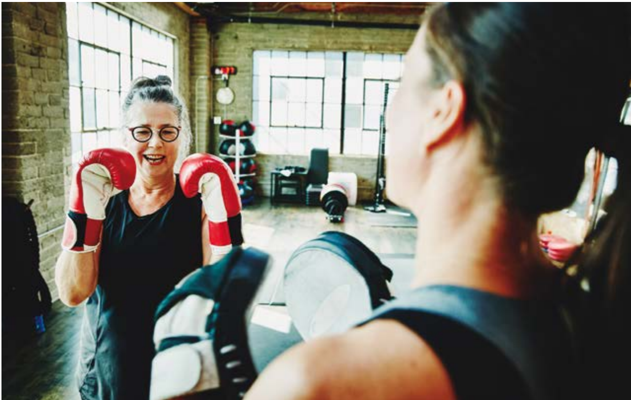
Laughing mature woman boxing with coach in gym

*** University of Texas Medical Branch, almichael@utmb.edu